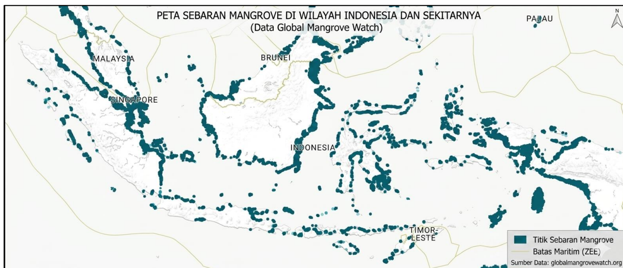
Gambar 1. Sebaran Ekosistem Mangrove Indonesia Berdasarkan Data Global Mangrove Watch Tahun 2020

Analisis spasial berbasis Geographic Information Systems menunjukkan bahwa perubahan tutupan lahan mangrove di Indonesia dalam dua dekade terakhir didominasi oleh aktivitas antropogenik, khususnya konversi kawasan mangrove menjadi tambak budidaya, ekspansi kawasan industri pesisir, pembangunan pelabuhan, reklamasi pantai, serta pertumbuhan kawasan permukiman pesisir. Perubahan tersebut menyebabkan fragmentasi habitat, penurunan biomassa, dan hilangnya fungsi ekologis yang sebelumnya berperan dalam menjaga stabilitas wilayah pesisir.